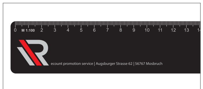
Vollflächiger Druck / All over printed