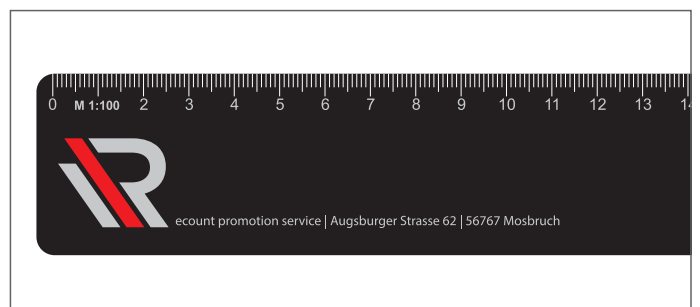
Vollflächiger Druck / All over printed